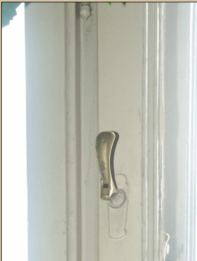
okenní klička boční části okna