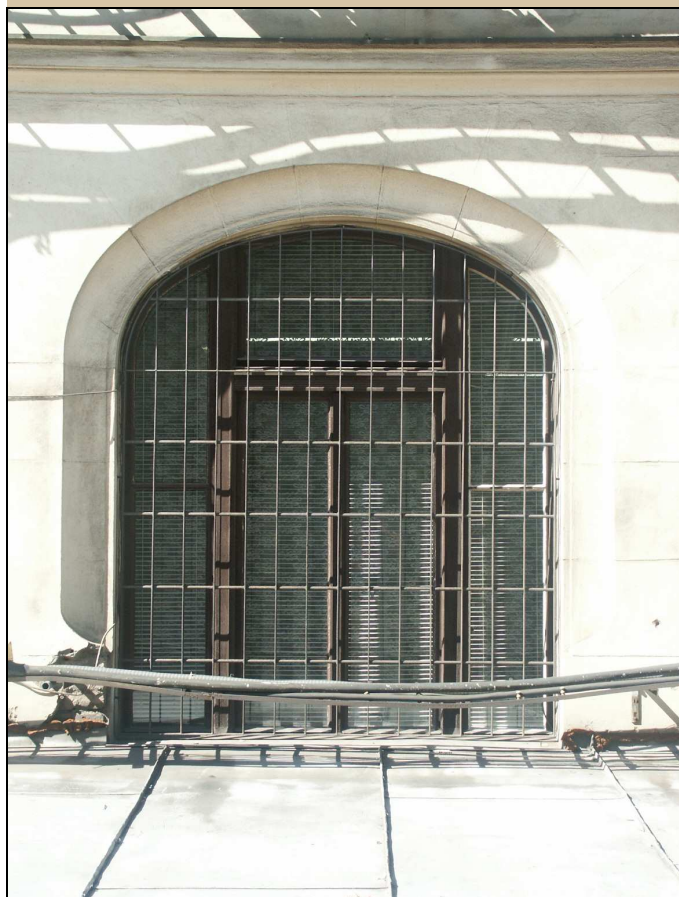
okno – celkový pohled z exteriéru

NÁVRH: repasovat, ponechat na původním místě, zachovat kličky, závěsy, zasklení (je-li historické), obnovit původní barevnost oken, bude-li zjištěna, nebo provést nátěr dle stávajícího stavu, s výjimkou kliček natřít i kování – viz stávající stav Obnovit původní barevnost podle průzkumu barevnosti oken. Z interiéru obnovit bílý nátěr, z exteriéru obnovit povrchovou úpravu, shodnou jako u již rekonstruované části C. Viz technologický postup TP/118.