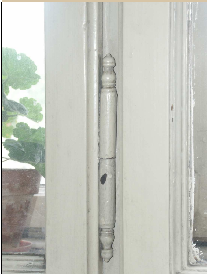
okenní zapuštěný závěs